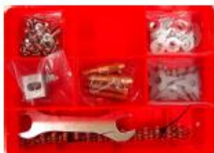
Skrzynka z akcesoriami